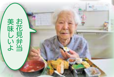
お花見弁当 美味しいよ