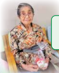
母の日に手作りの プレゼントを 贈りました