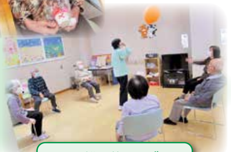
風船を落とさず 何回続けられるかな?