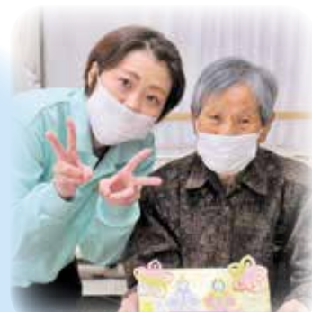
お雛飾りの完成です!