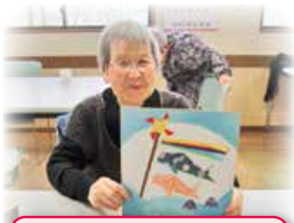
ひ孫に見せたいなあ