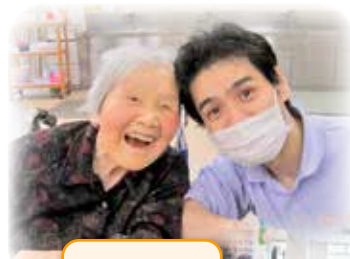
皆さんの笑顔に パワーを 貰っています!