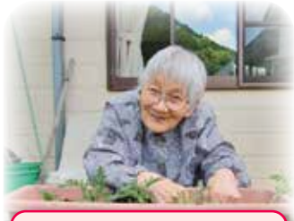
どんな花が咲くかなあ?