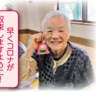
早くコロナが 収束しますように!