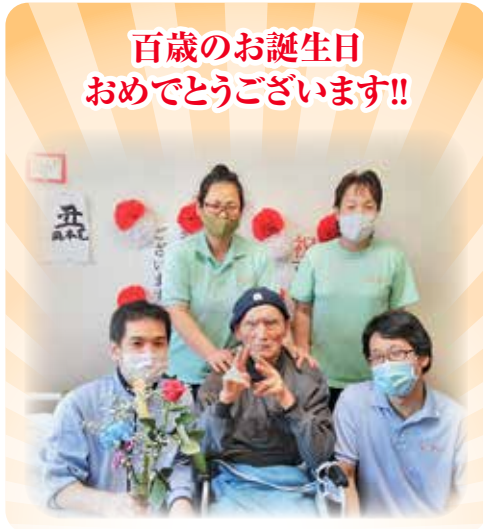
百歳のお誕生日 おめでとうございます!!