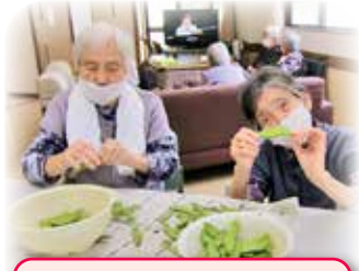
いいエンドウができたね