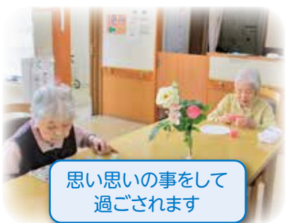
思い思いの事をして 過ごされます