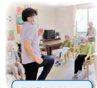
体を動かしましょう