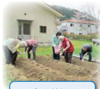
じゃがいも植えたよー