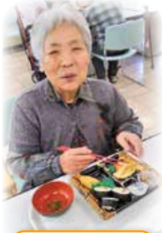
お花見弁当 美味しいな