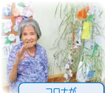
コロナが 収束しますように