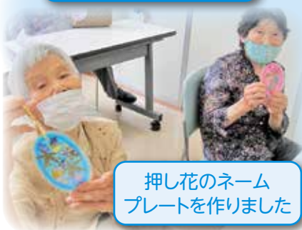
押し花のネーム プレートを作りました