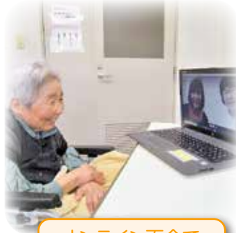
オンライン面会で 話が弾みます!