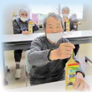
屋根より低い 鯉のぼり(笑)