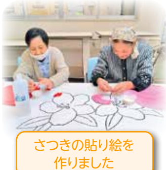
さつきの貼り絵を 作りました