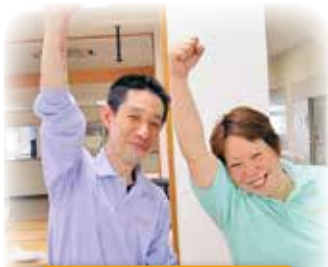
コロナなんか 負けないぞ!