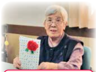
何が入っているか楽しみ!